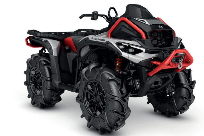
Hyper Silver & Legion Red