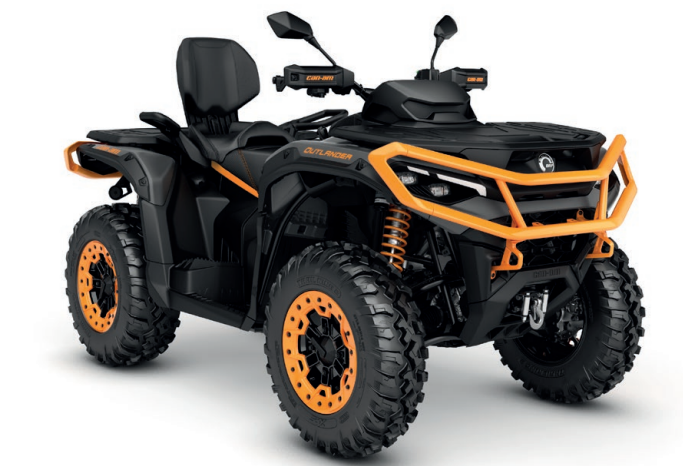
Mineral Grey & Orange Crush