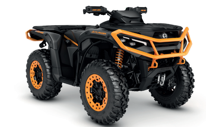
Mineral Grey & Orange Crush