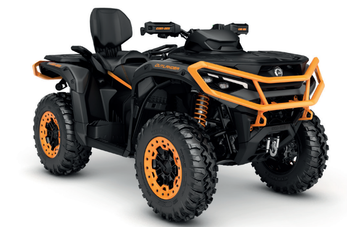
Mineral Grey & Orange Crush